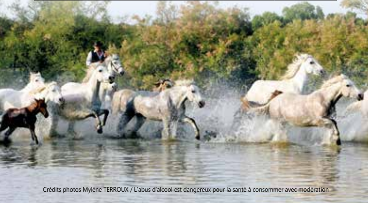
L'abus d'alcool est dangereux pour la santé à consommer avec modération